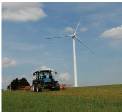
Herbages et vent: Utilisons nos ressources avec efficacité!

A l'avenir, nous devons produire toujours davantage pour une population croissante sur une surface agricole toujours plus restreinte. Un tel défi ne pourra être relevé que si nous utilisons nos ressources efficacement et durablement.